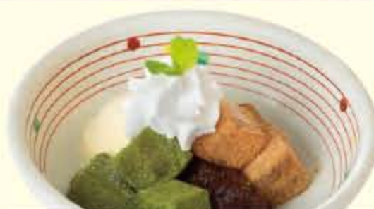
わらび餅 480円 (税込 528円 )