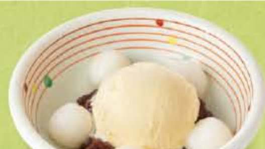
白雪... 400円 (税込 440円 )