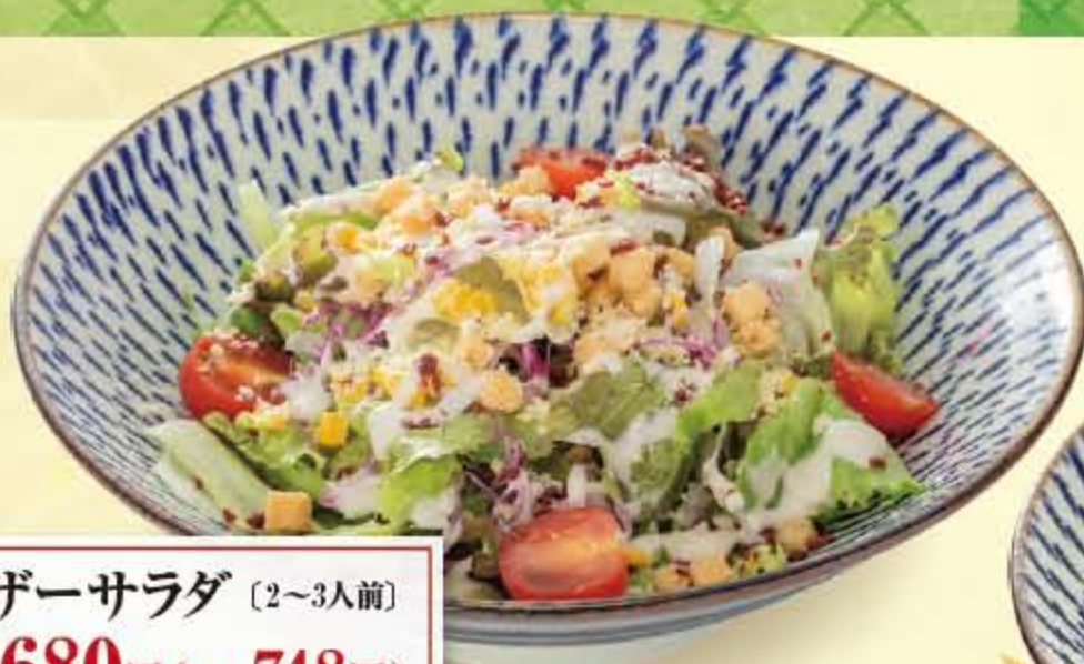
シーザーサラダ (2~3人前) ..... 680円 (税込 748円 )